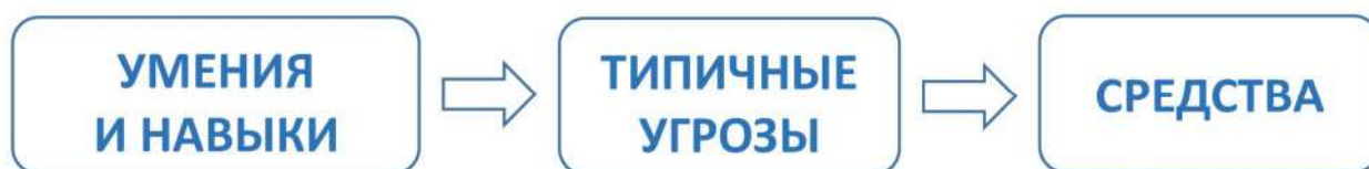
Рис. 4. Общий алгоритм выбора средств информационной гигиены

Выбор средств обеспечения информационной гигиены должен осуществляться сообразно базовой группе умений и навыков в зависимости от характера конкретных угроз (рис. 4).