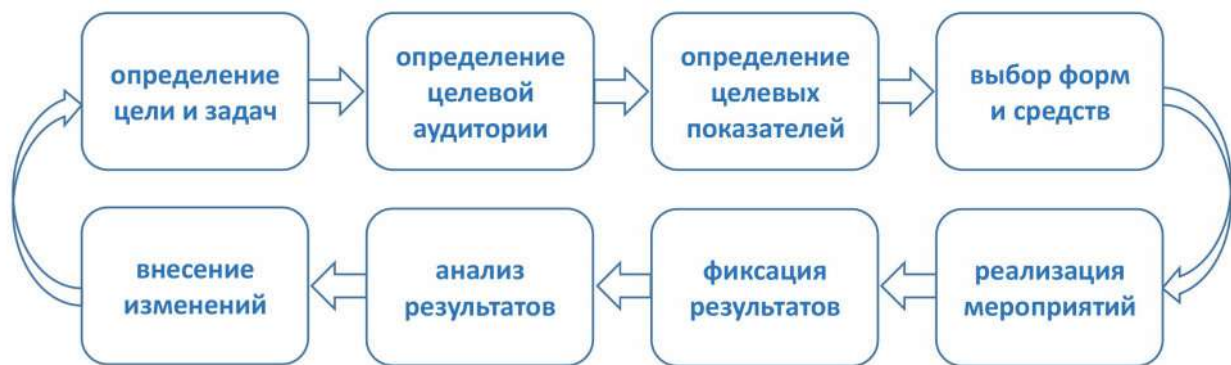
Рис. 5. Общий алгоритм профилактической деятельности