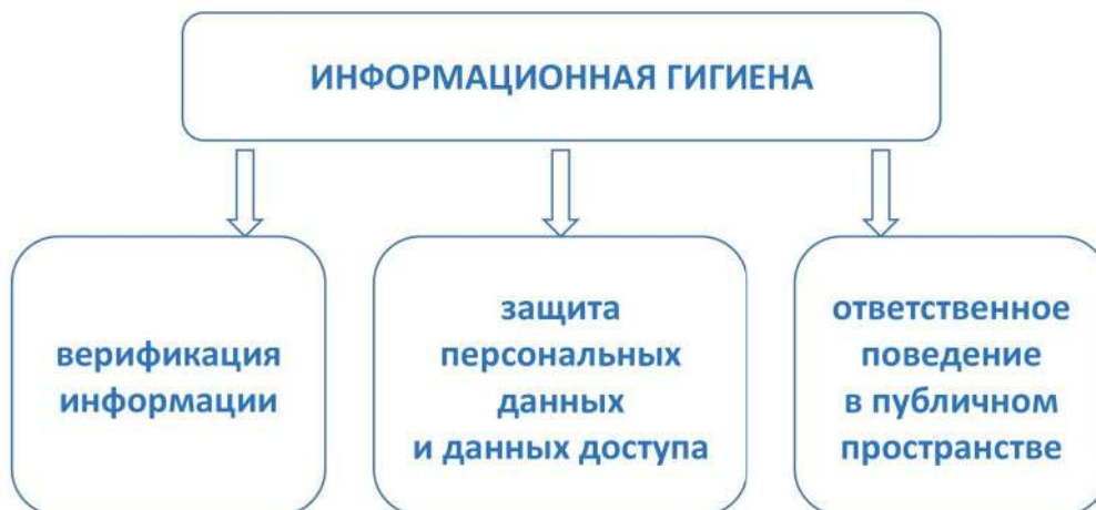
Рис. 2. Базовые умения и навыки информационной гигиены

В соответствии с указанными умениями будут варьироваться угрозы, против которых должны быть направлены навыки информационной гигиены.