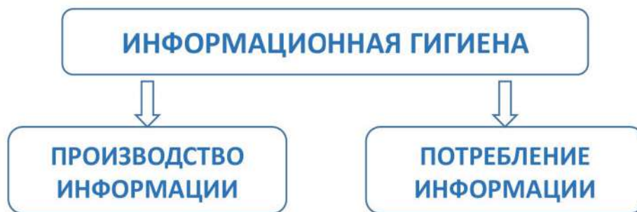
Рис. 1. Векторы применения информационной гигиены

Исходя из поставленной задачи, целесообразно дать следующее определение: информационная гигиена — это совокупность компетенций, позволяющих обеспечить безопасность взаимодействия индивида с информационной средой и направленных на формирование умений и навыков осознанного и ответственного потребления и производства (распространения) информации.