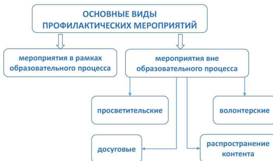
Рис. 6. Основные виды профилактических мероприятий

Следует отметить, что форм и видов профилактических мероприятий может быть множество, как и форм любой образовательной и воспитательной деятельности. Поэтому далее будут приведены лишь некоторые варианты. Основными видами при этом будут профилактические мероприятия в рамках учебного процесса и за его пределами, включая просветительскую деятельность, досуг, изготовление и распространение профилактического контента, волонтерство (рис. 6).