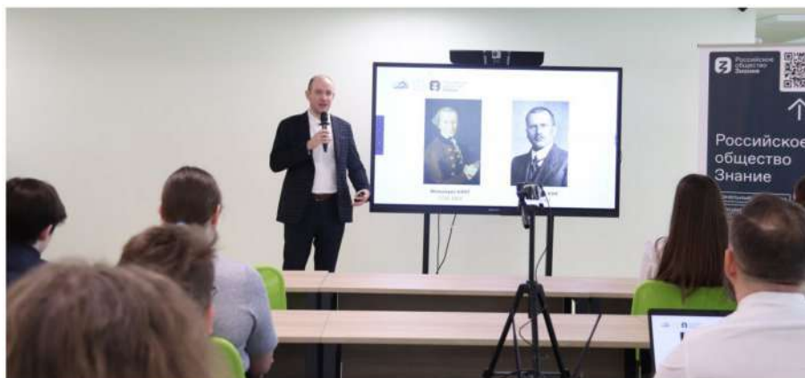
Рис. 9. Публичная просветительская лекция «Критическое мышление и информационная гигиена», организованная Российским обществом «Знание» 1 и проходившая на базе МАУ СОШ № 59 г. Калининграда с интернет-трансляцией для 11 школ Калининградской области (всего очно и дистанционно в мероприятии приняли участие 180 учащихся)

Особенности: как правило, подобный формат реализуется в свободное от образовательного процесса время. При этом открытая лекция может проходить как в стенах образовательного учреждения (рис. 9), так и любого учреждения культуры, молодежной политики или вообще на независимых площадках. Например, такие мероприятия востребованы библиотеками, молодежными клубами, муниципальными культурно-досуговыми центрами. Если нет возможности напрямую контактировать с данными организациями, то можно обратиться к их учредителям — региональным органам государственной власти и местного самоуправления. Помощь в организации подобных открытых лекций могут оказывать также некоммерческие организации, в частности Российское общество «Знание». Для реализации этого вида профилактических мероприятий одним из самых важных требований является качественно подготовленная презентация. Также в конце выступления обязательно необходимо оставлять время на вопросы из аудитории.