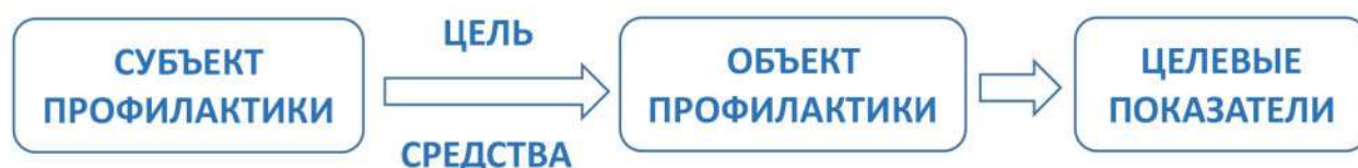
Рис. 3. Структура профилактической работы

Профилактическая работа, направленная на формирование умений и навыков информационной гигиены, должна начинаться с четкого понимания субъекта, объекта, целей, средств и результатов данной деятельности (рис. 3). Кроме того, следует представлять спектр угроз, которым призвана противостоять информационная гигиена и которые будут подробнее охарактеризованы ниже. Также важно помнить, что только жесткая привязка к практикам современной повседневности, касающимся каждого индивида, взаимодействующего с информационной средой, только указание конкретных примеров из жизни, связанных с нарушением законных прав и свобод гражданина, могут обеспечить подлинный интерес целевой аудитории проводимой работы.