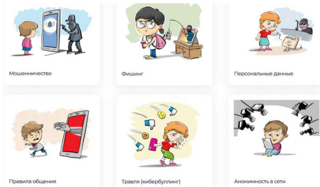
Рис. 10. Информационные памятки для детей и подростков с сайта Лиги безопасного Интернета