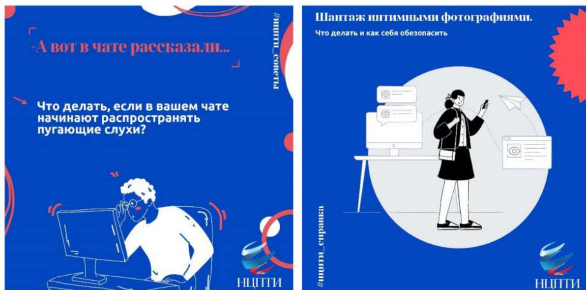
Рис. 13. Разъясняющие карточки НЦПТИ

НЦПТИ был создан в 2012 году на базе НИИ «Спецвузавтоматика» с целью оказания информационно-аналитического, методического и технологического сопровождения деятельности ФОИВ, ОИВ субъектов Российской Федерации и образовательных организаций по противодействию идеологии терроризма и иным радикальным проявлениям в образовательной сфере и молодежной среде. Несмотря на то что профильными являются указанные выше цели, на сайте есть образовательный контент, направленный на формирование базовых представлений об информационной гигиене (рис. 13). Кроме того, НЦПТИ проводит тематические профилактические мероприятия, например Киберквиз.