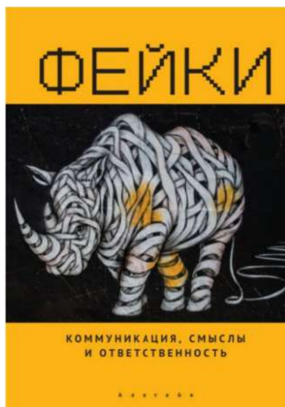
Рис. 12. Одна из первых в России монографий о фейках

Монография «Фейки: коммуникация, смыслы, ответственность» стала, пожалуй, первой в истории отечественной науки попыткой систематического осмысления проблемы появления фейков (рис. 12). Книга представляет собой результат кропотливой работы ученых из БФУ им. И. Канта. Она может быть полезна как для повышения собственной квалификации в сфере информационной гигиены, так и для использования ее материалов в образовательном процессе.