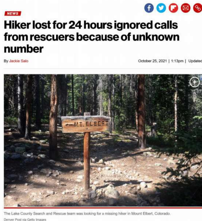
Рис. 7. Статья из газеты «Нью-Йорк Пост» о потерявшемся туристе, который не отвечал на звонки с незнакомых номеров

Одной из сложностей, которые могут возникнуть с проведением такого вида занятий, является возбуждение интереса аудитории, которая в рамках учебного процесса может ничего особенного не ждать от преподавателя, воспринимая урок как рутину. Здесь важно начать занятие с какого-то интересного случая или примера того, как знание или незнание основ информационной гигиены сказывается на жизни людей. Так, буквально недавно заблудившийся турист из Колорадо сутки не отвечал на звонки спасателей, так как они были с незнакомого номера 1 (рис. 7). К счастью, все обошлось, однако такая явно невротическая установка могла привести к трагедии. Все потому, что для человека, плохо владеющего навыками информационной гигиены, действительно любой незнакомый звонок становится проблемой и ввергает в состояние страха и растерянности, хотя в таких случаях важно не терять самообладание и помнить, что с незнакомого номера может звонить близкий человек, у которого сел или пропал телефон.